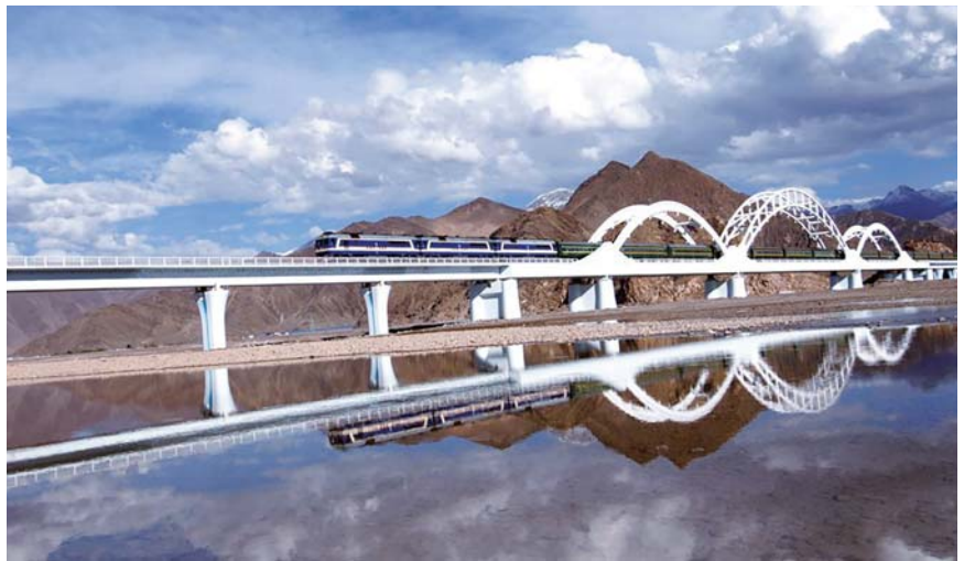
● 中铁大桥局修建的青藏铁路重点工程拉萨河大桥，为保障藏羚羊的正常生活繁衍，铁路沿线设置了33处野生动物通道

各国质量创新版本相继出台：美国质量学会推出的质量4.0版本，重点关注大数据、创新和全球供应链，风险与变革及其解决方案和方法工具；韩国政府和质量组织正在