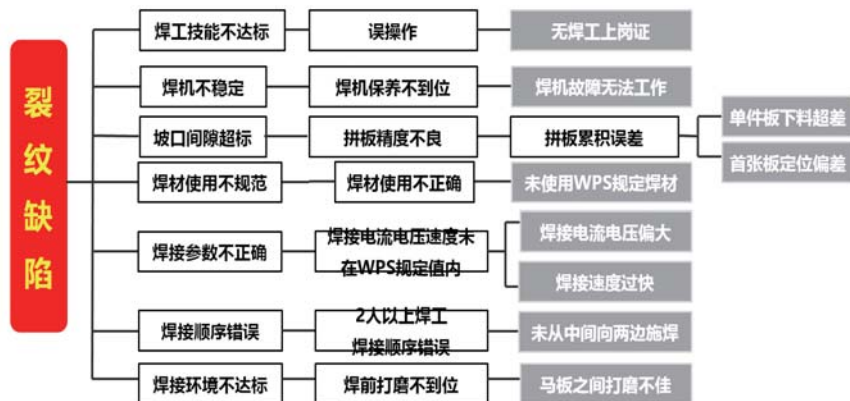
图2 裂纹缺陷分析系统图

布图、柱状图，数据对比等工具和方法，最终识别确定造成打底焊裂纹产生的2个主要原因：首张板装配定位偏差和焊接电流电压偏大。